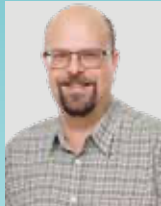
Christian Plate Gehrden, Platz 9